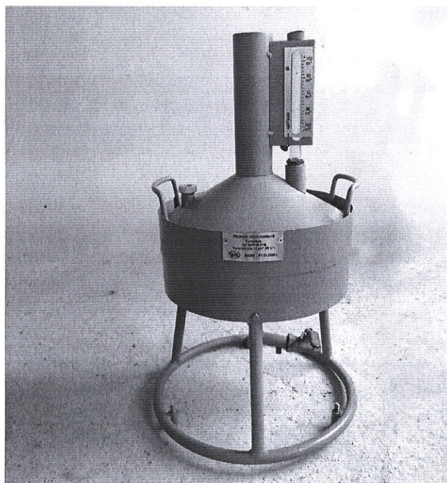
Рисунок 2 - Внешний вид мерника 2-го разряда с рамой